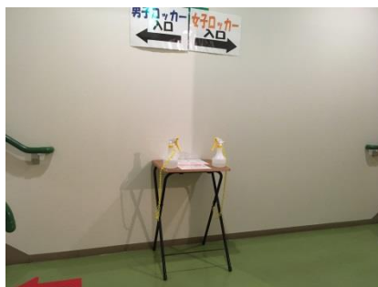
男女ロッカー出入口